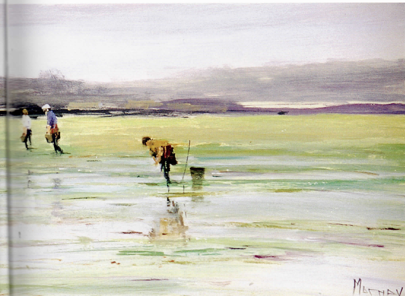
MAREA SECA Óleo/tábla • 73 x 27 cm.