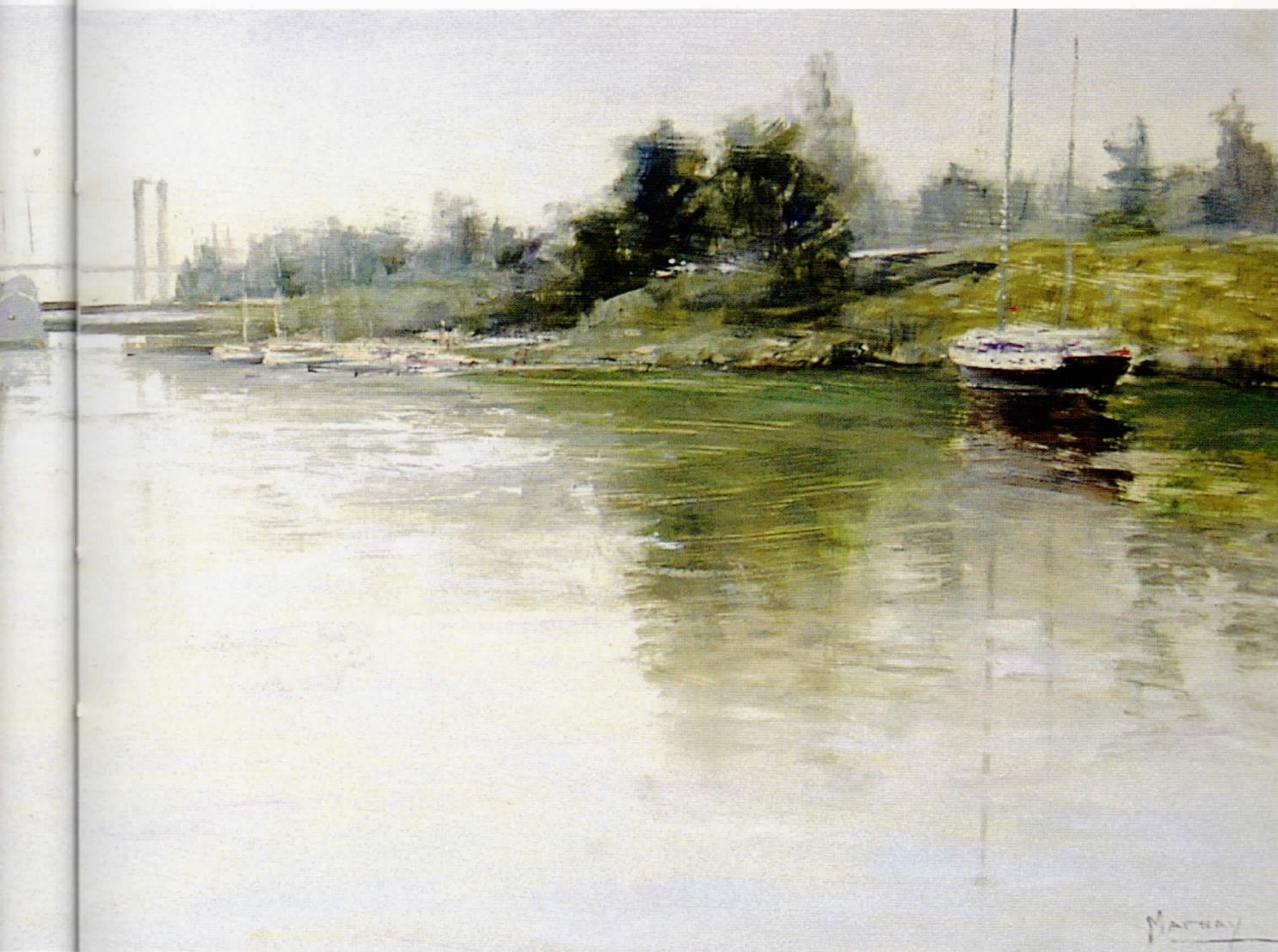
RÍO GUADALQUIVIR Óleo/tabla • 122 x 50 cm.