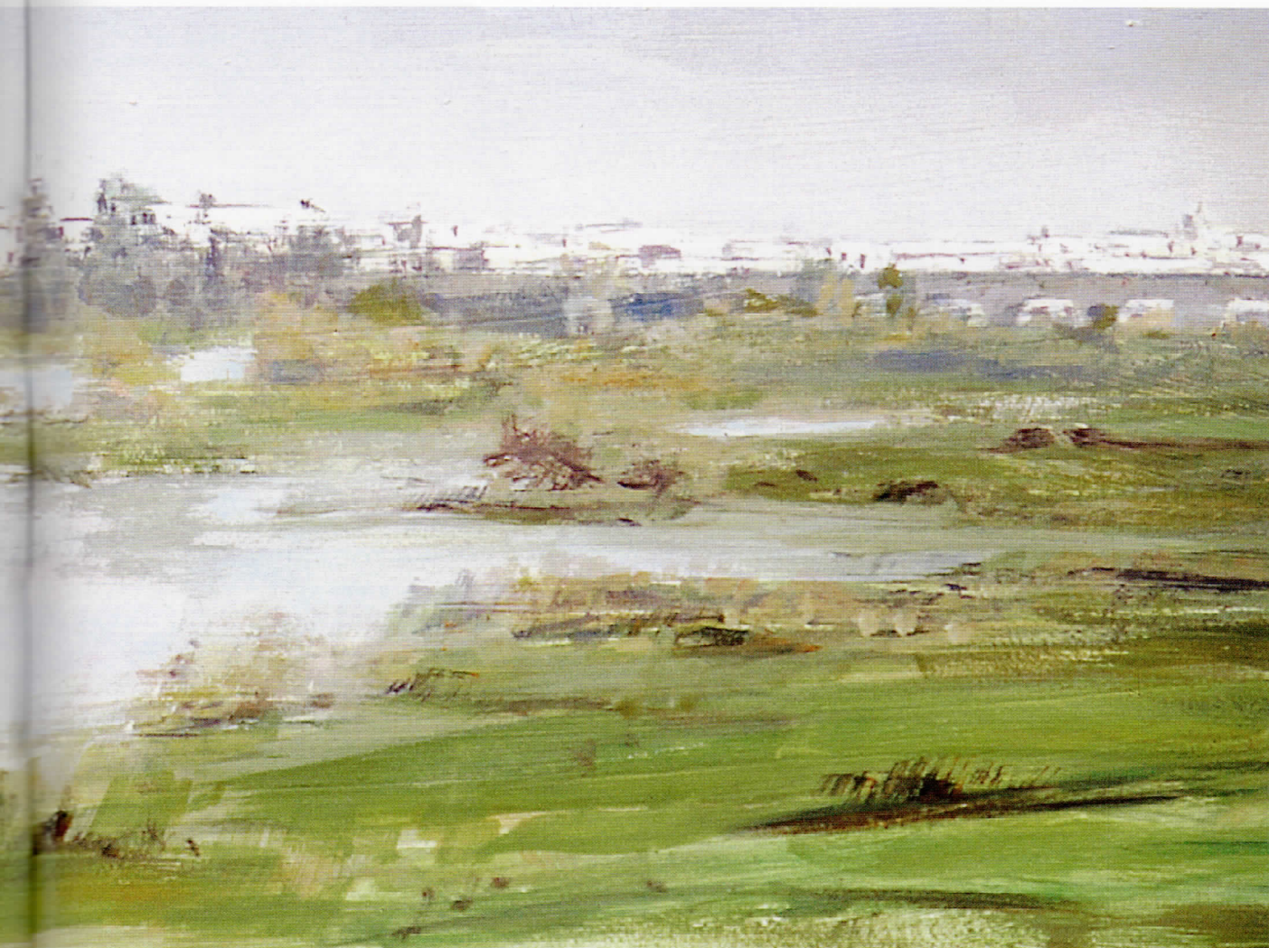
POR CÓRDOBA EL OUED-EL-K'BIR Óleo/tabla • 73 x 27 cm.