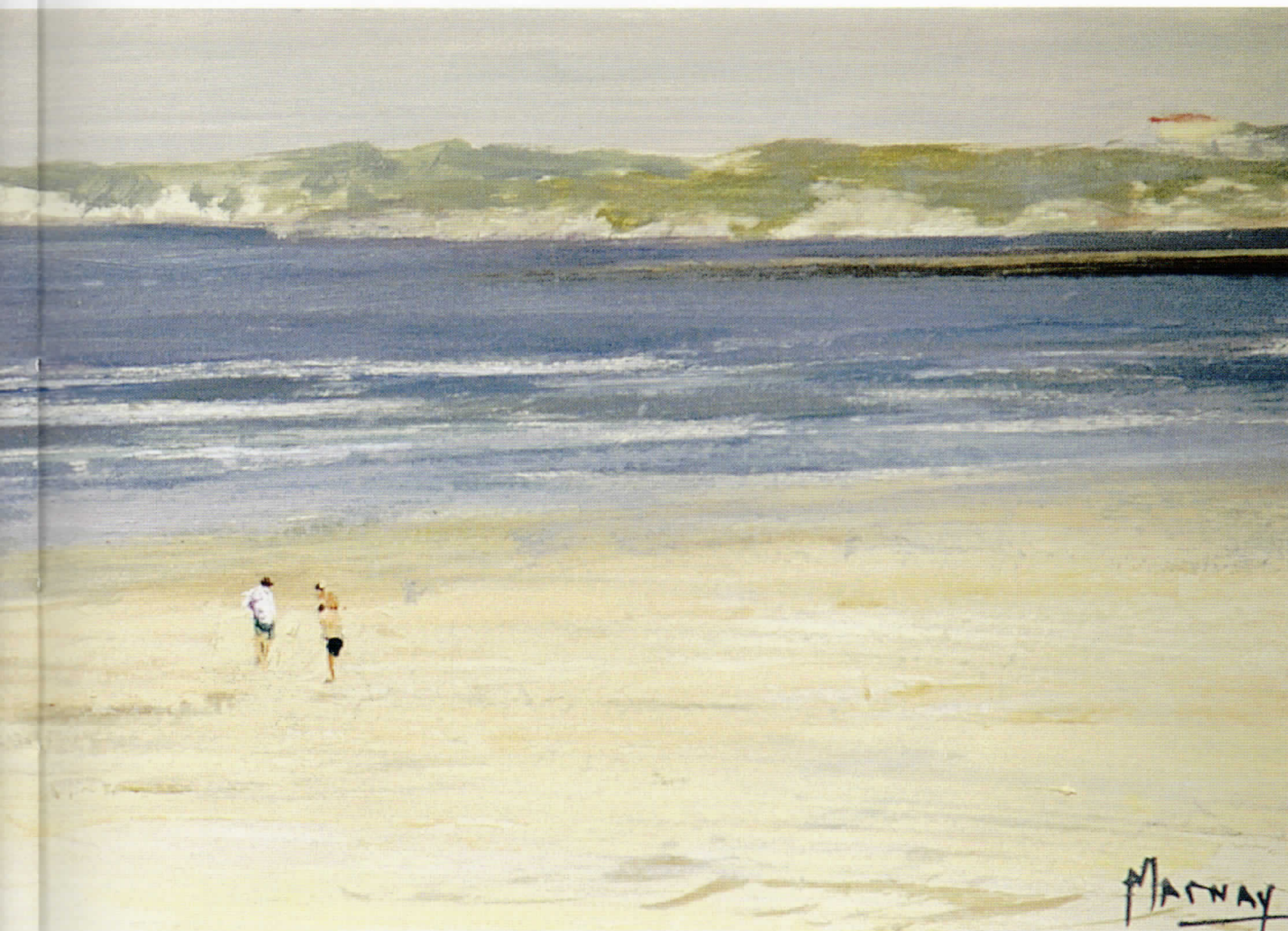
PLAYA CON FIGURAS. SUANCES Óleo/tabla • 44 x 16 cm.