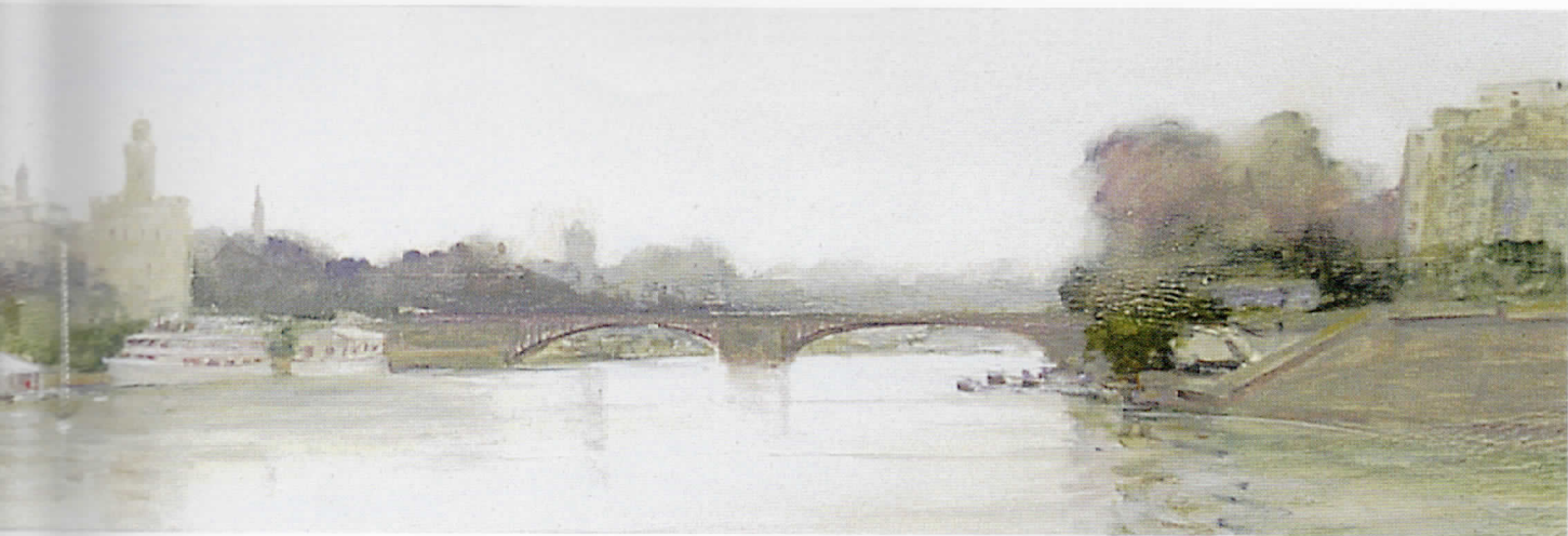
RÍO GUADALQUIVIR POR SEVILLA Óleo/tabla • 136 x 22 cm.