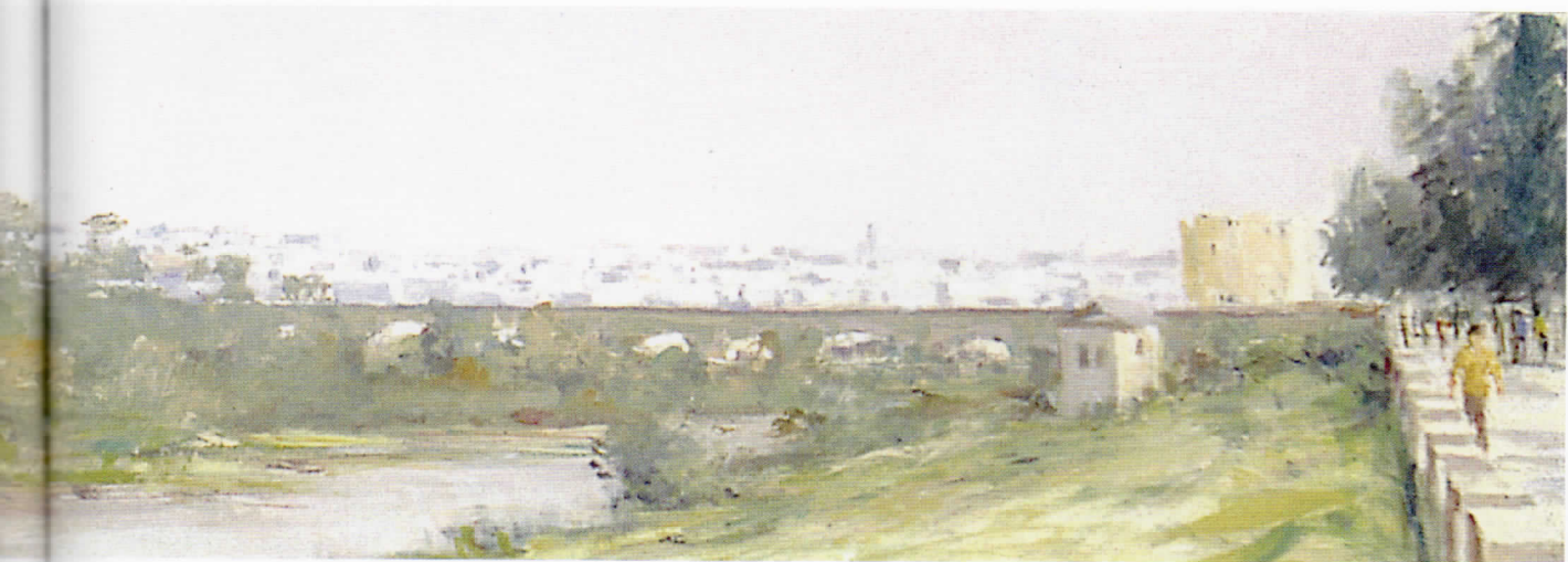
RÍO GUADALQUIVIR POR CÓRDOBA Óleo/tabla • 136 x 122 cm.