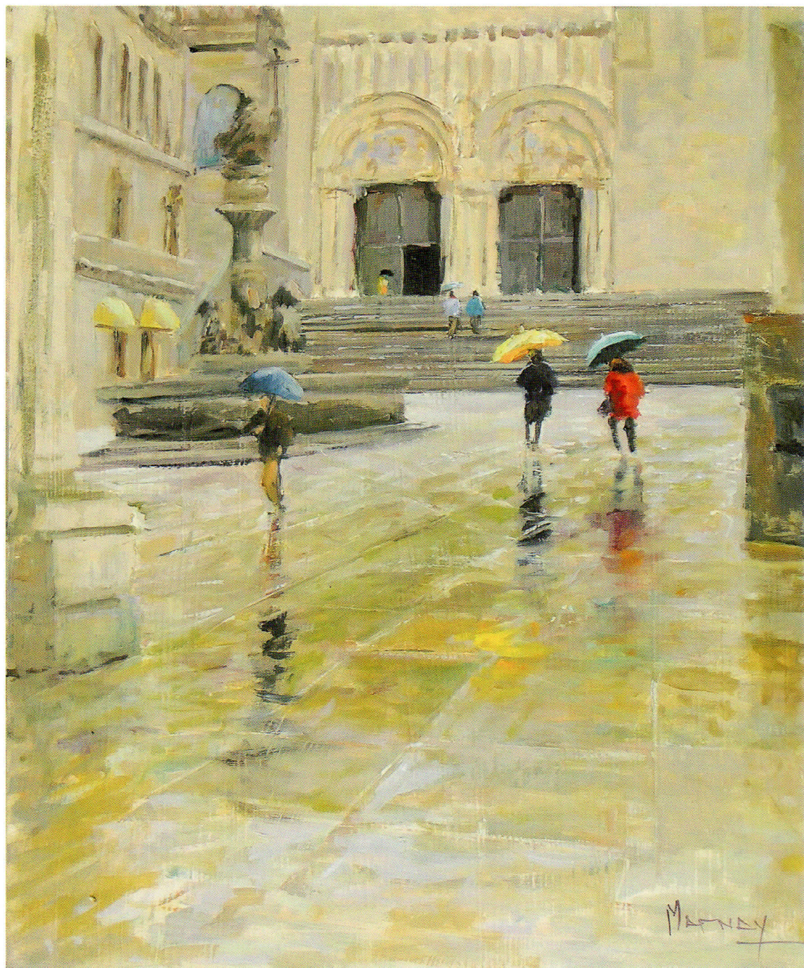
PRAZA DAS PRATERIAS óleo sobre tabla. 38 x 46 cm.