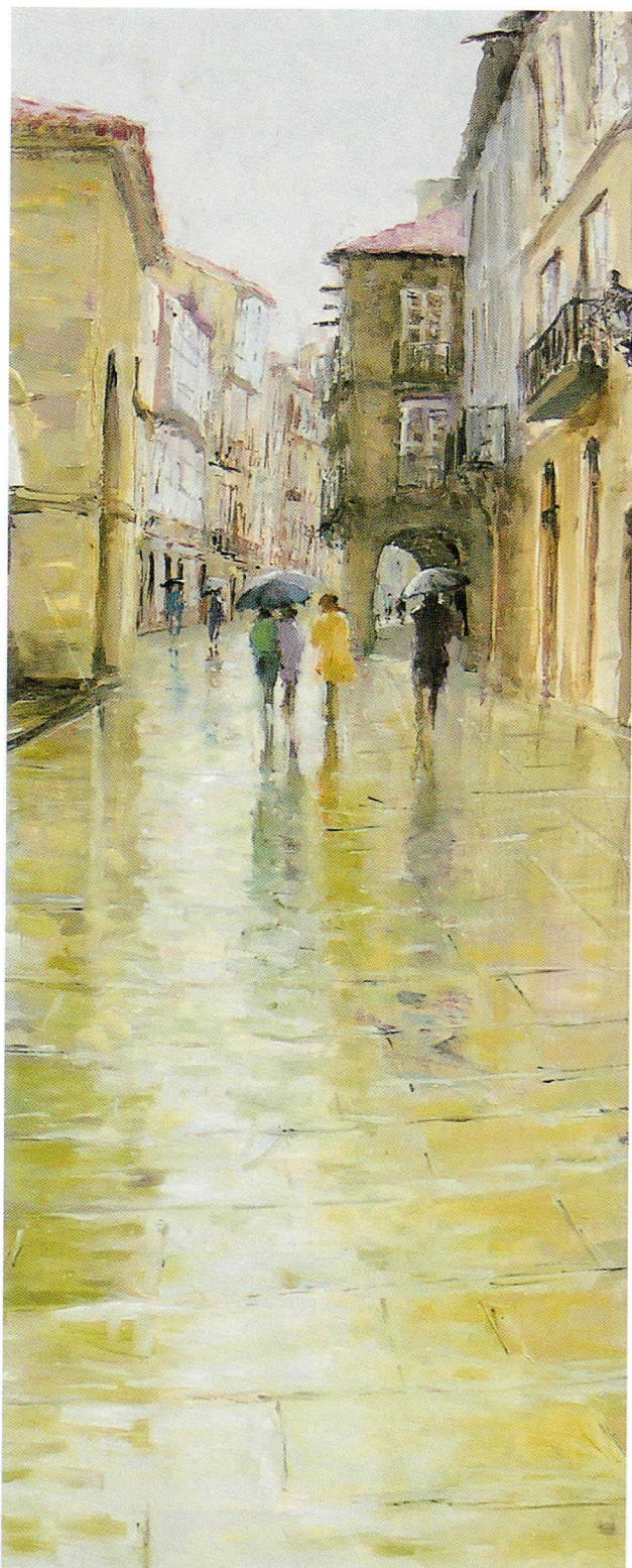
RÚA NOVA (detalle) óleo sobre tabla. 50 x 61 cm.