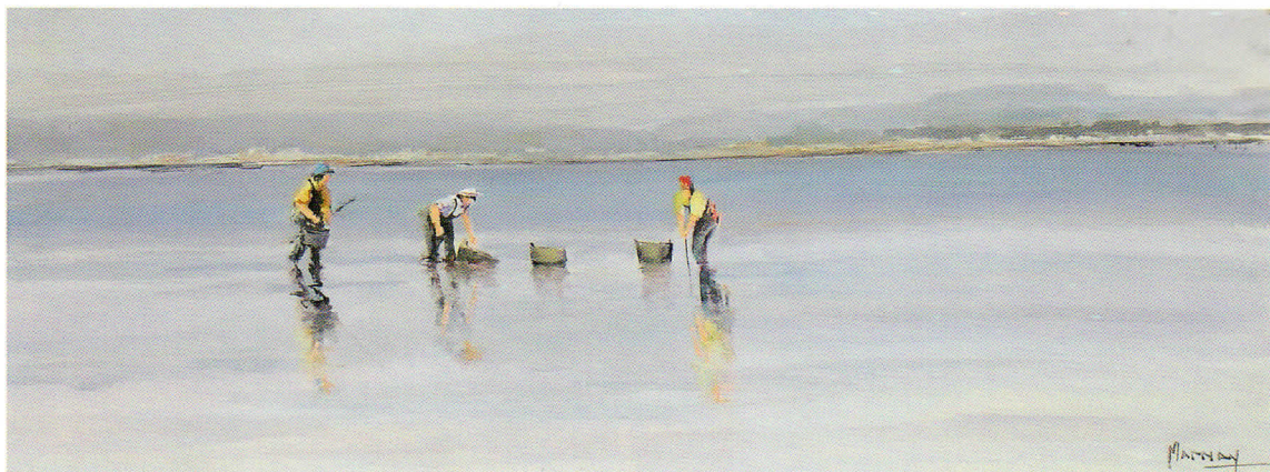
MARISCADORAS EN LA RÍA DE AROSA óleo sobre tabla. 73 x 27 cm.