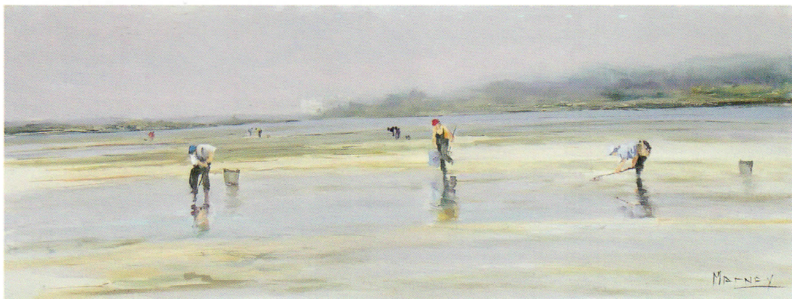
MARISCANDO FRENTE A LA TOJA óleo sobre tabla. 73 x 27 cm.