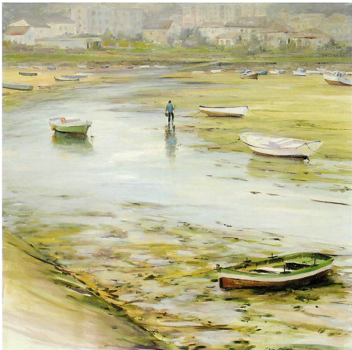
BAJAMAR EN ESTEIRO óleo sobre tabla. 80 x 80 cm.