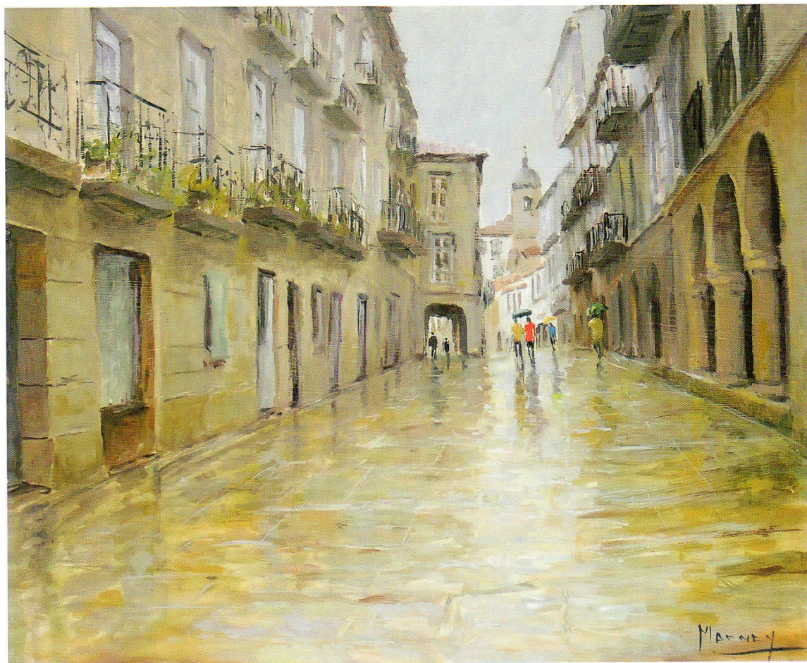
RÚA NOVA óleo sobre tabla. 61 x 50 cm.