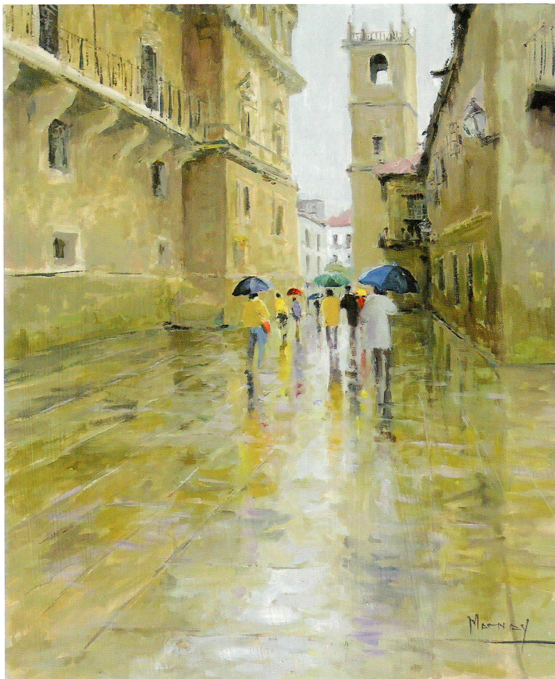
HACIA FONSECA óleo sobre tabla. 38 x 46 cm.